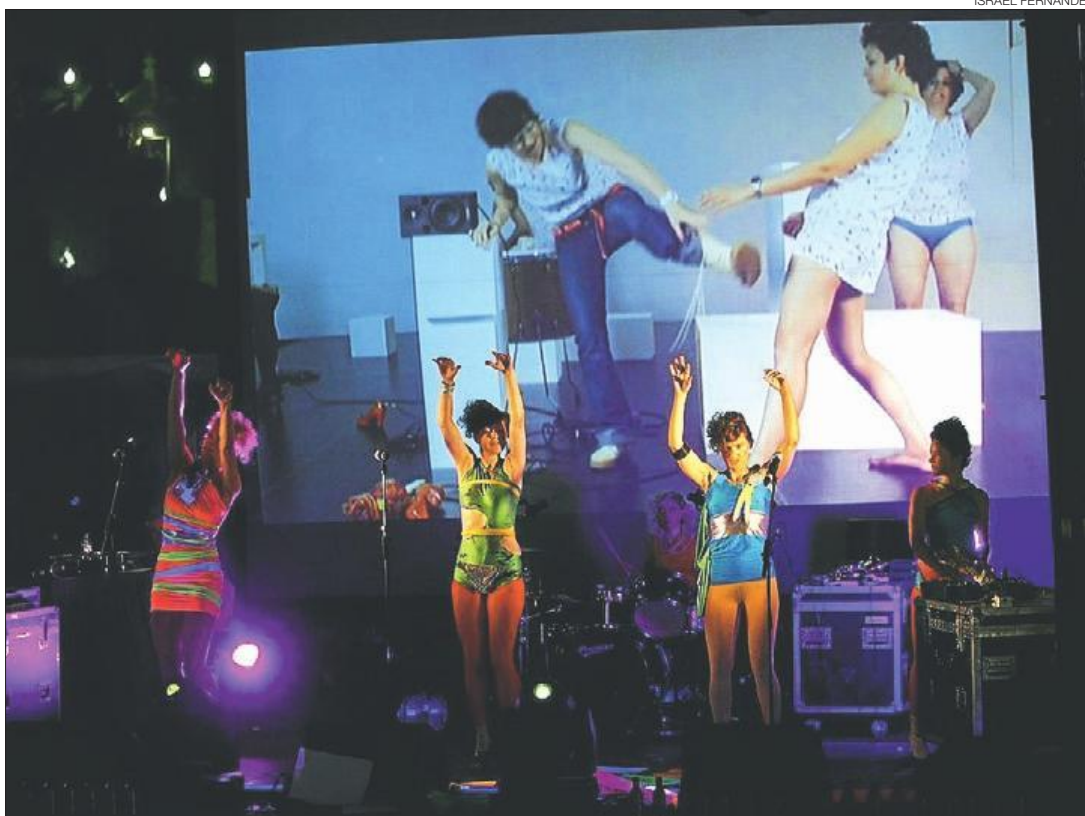
► El trío de pop electrónico Chicks on Speed, el martes por la noche, en plena actuación en la Fira de Montjuïc.