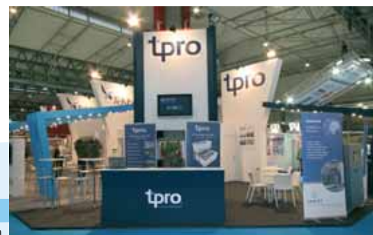
Servifira project Stand designed by Servifira