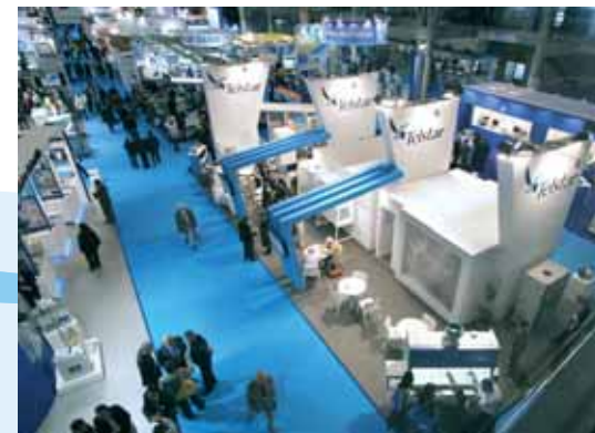
Servifira project Stand designed by Servifira